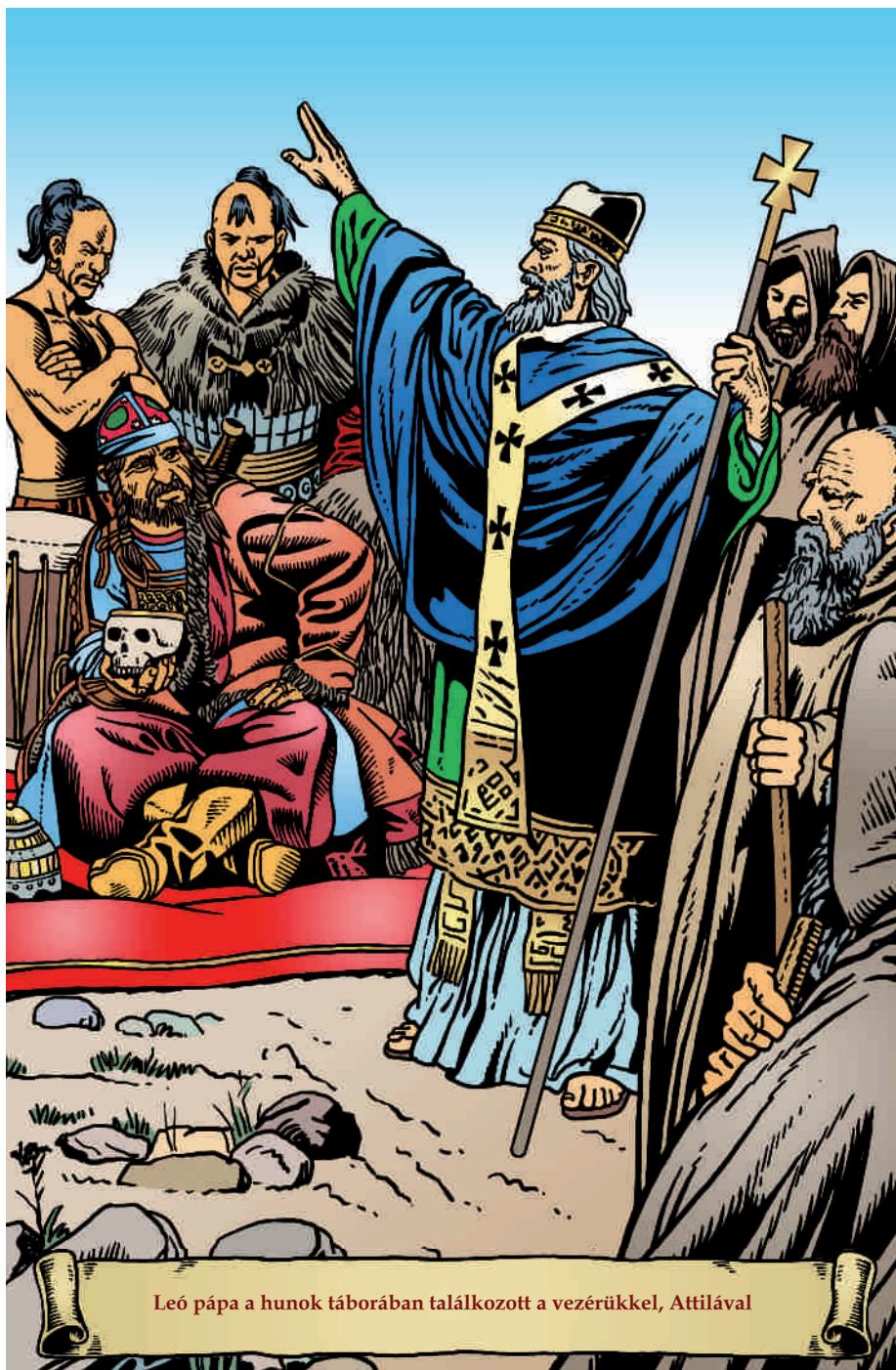
Leó pápa a hunok táborában találkozott a vezérükkel, Attilával